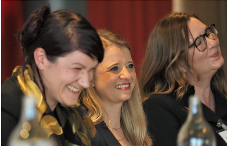
Viel Gelächter, aber auch engagierte Voten unterschiedlicher Standpunkte zu politischen Themen