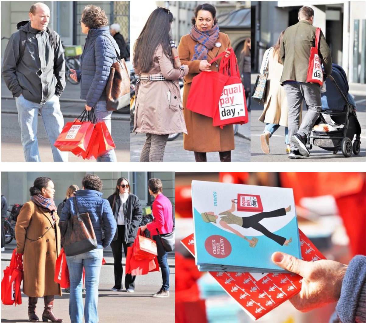
Engagierte Clubmitglieder verteilen Equal-Pay-Day-Taschen auf dem Casinoplatz in Bern.