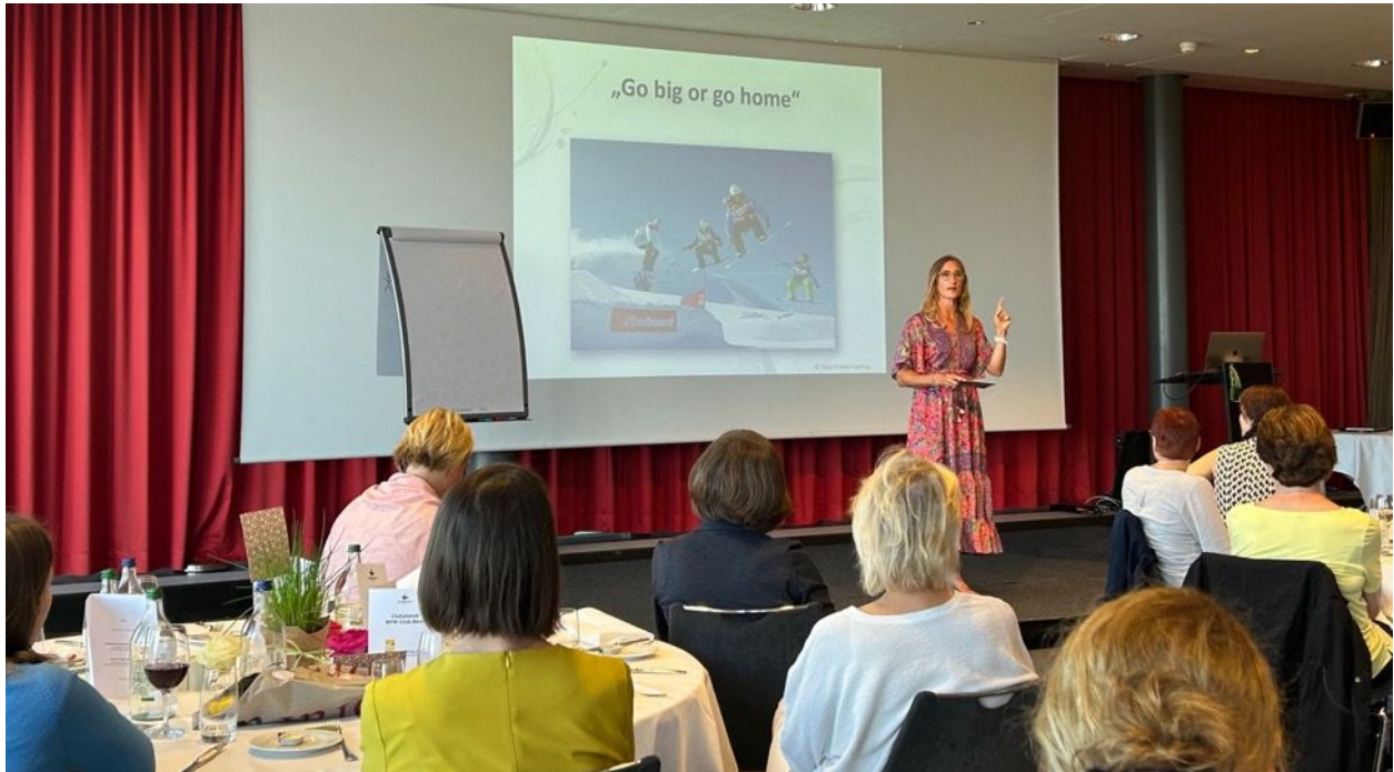
Ex-Olympiasiegerin Tanja Frieden gibt Tipps für Erfolg und Erfüllung.

Die ehemalige Spitzensportlerin, ausgebildete Lehrerin und Mutter eines 7-jährigen Sohnes arbeitet seit über 14 Jahren als Transformations- und Energie-Coach. Zudem ist sie Gründerin der Friedens Academy, wo Menschen begleitet werden, die Erfolg und Erfüllung zusammenbringen und bewusst einen Impact in der Welt machen wollen.