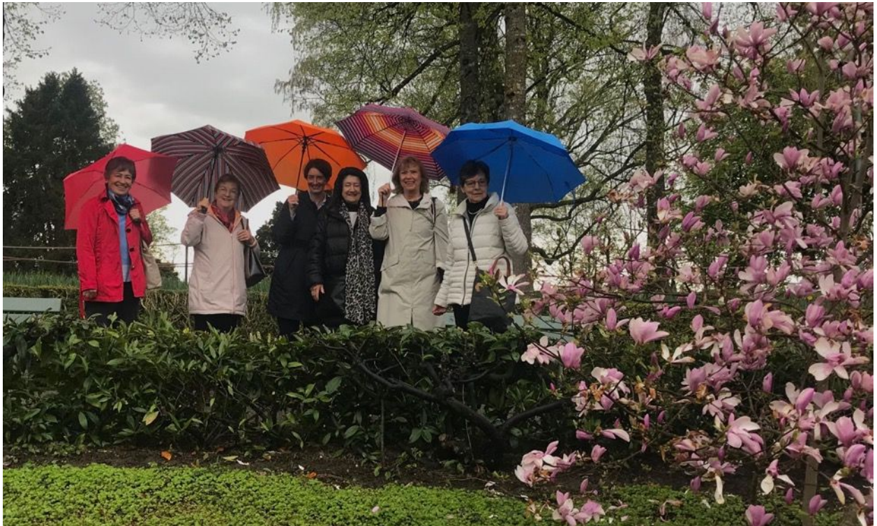
Viel Freude im Rosengarten trotz Regenwetter