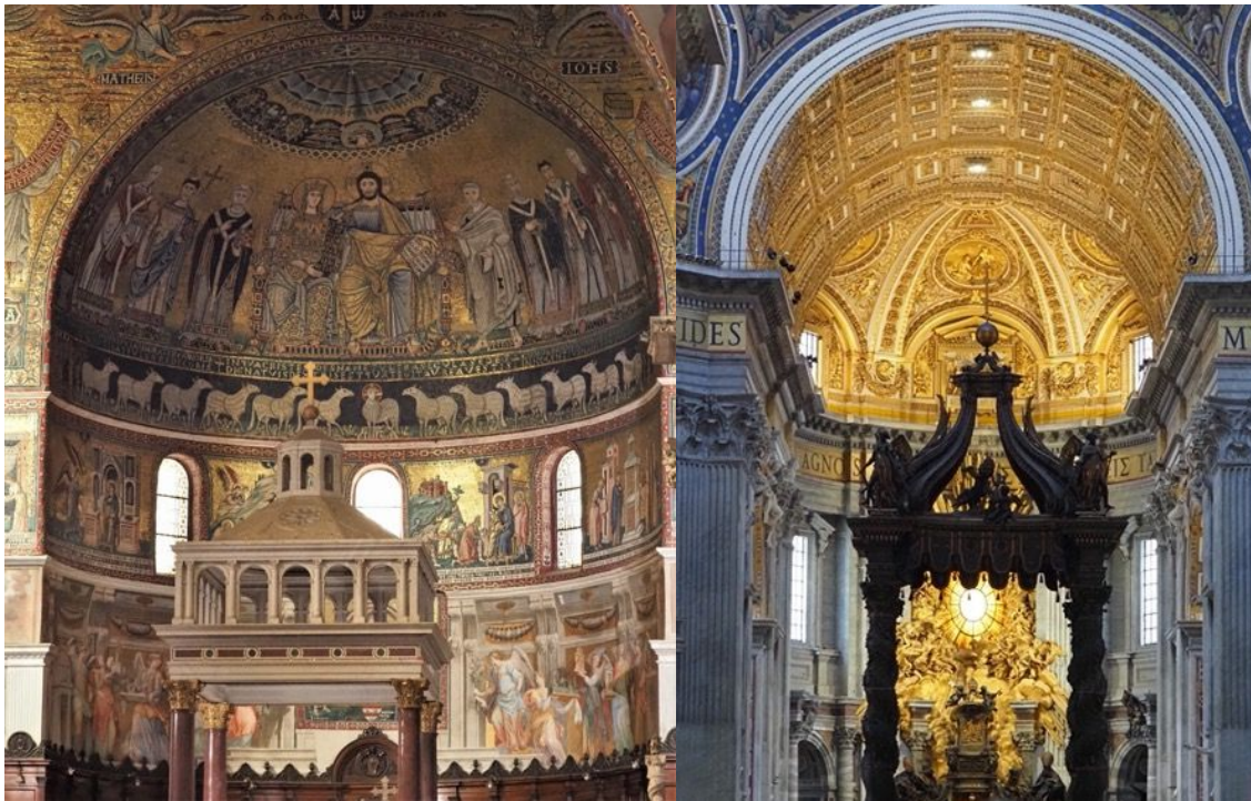
Das antike Rom beeindruckt mit vielfältigen, gut erhaltenen Bauten.