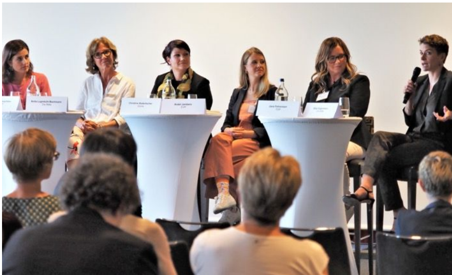
Interessiert hören sich die National- und Ständeratskandidatinnen über Parteigrenzen hinweg zu.