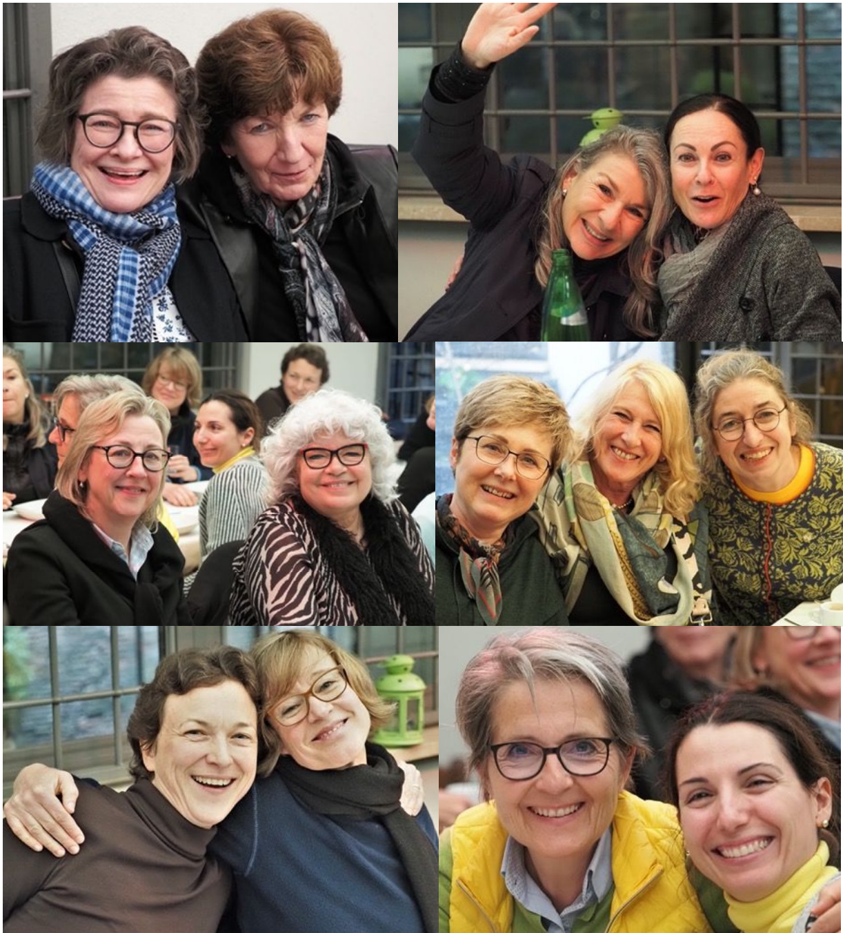
Trotz Streik-bedingt schwieriger Anreise und nasser Witterung: beste Stimmung bei den Berner BPW in Rom und im Vatikan.