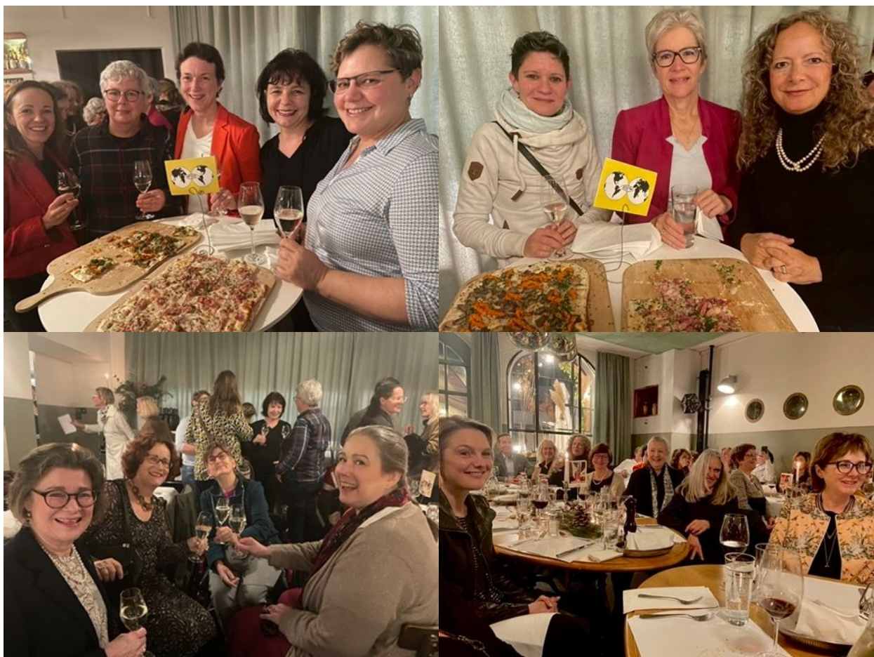
Intensiver Austausch und strahlende Gesichter: beste Stimmung am Jahresendanlass.

Die Stimmung ist angeregt, es entstehen neue Freundschaften, und Kreise schliessen sich.