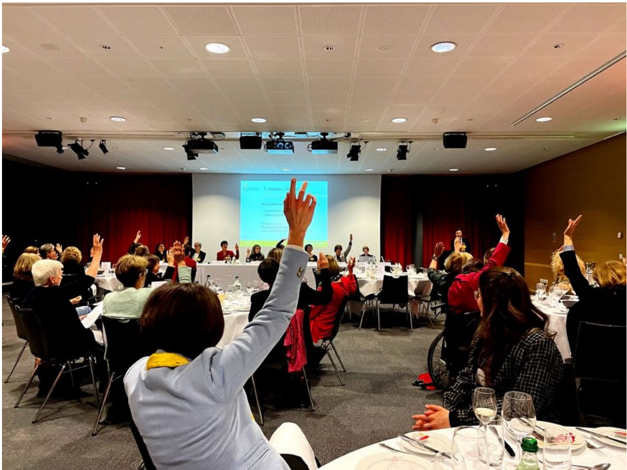
Klare, oft gar einstimmige Entscheide an der gut besuchten Mitgliederversammlung.

Weiter werden per Abstimmung alle Anträge gemäss Traktandenliste angenommen – teils mit 100 %, teils mit grossem Mehr.