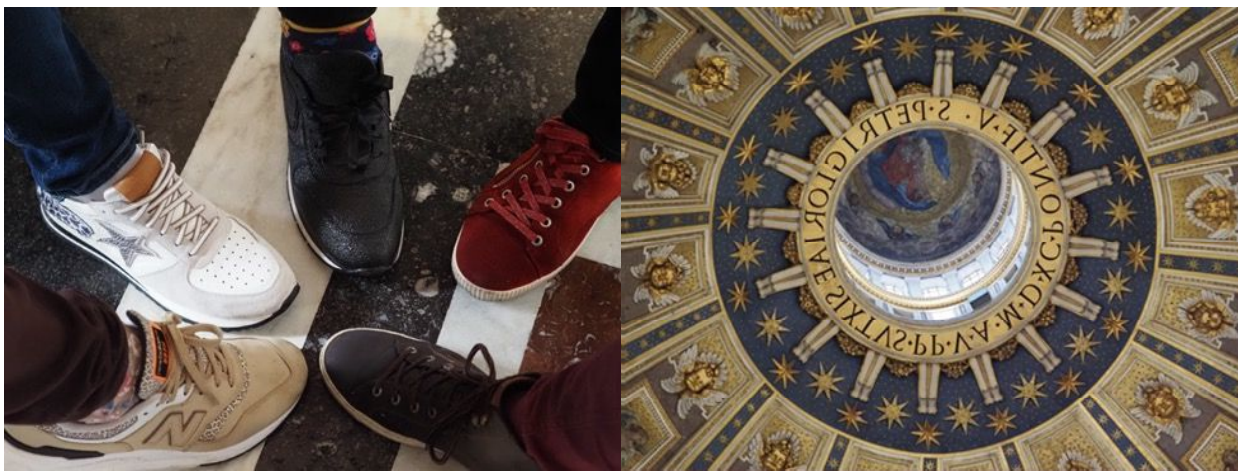
Was gibt es hierzu zu sagen?