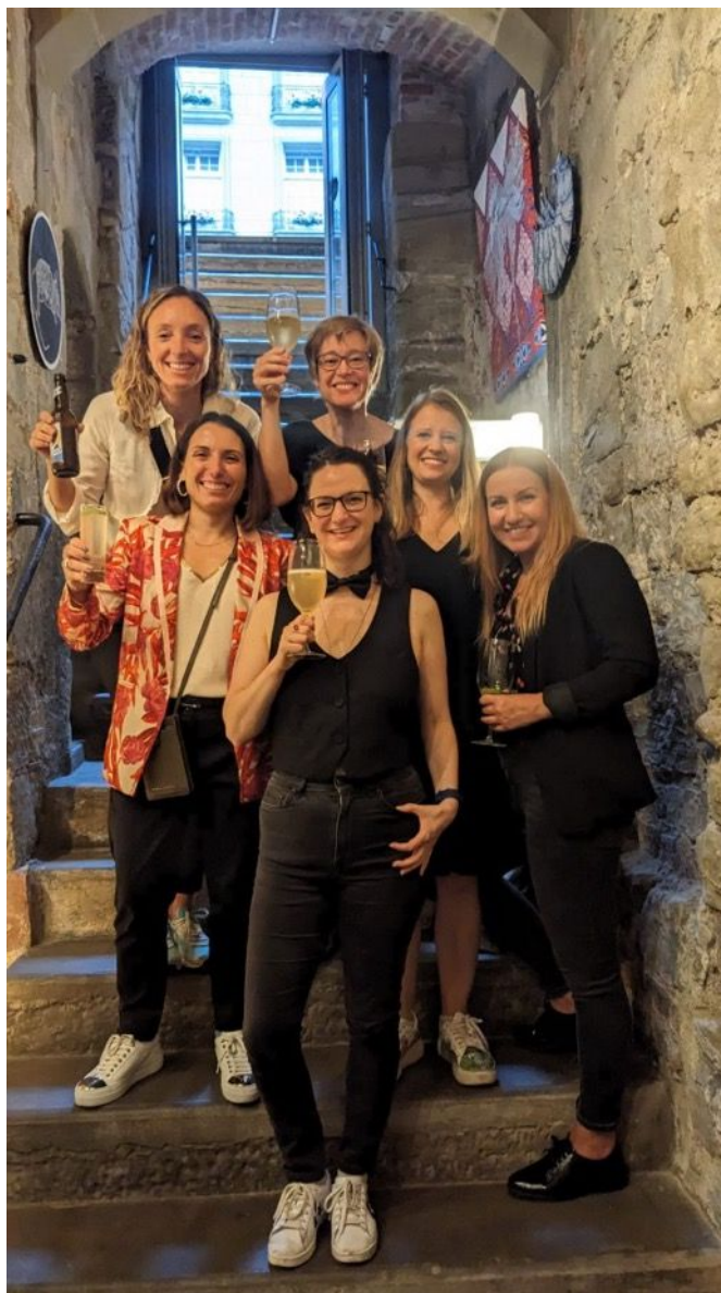
Die AG Vereinbarkeit stösst auf ihre erste VereinBar an.

Rund 25 Frauen und auch einzelne Männer geniessen speziell für den Anlass kreierte Drinks und beteiligen sich an den angeregten Diskussionen, die sich im Anschluss an die Programmpunkte spontan ergeben.