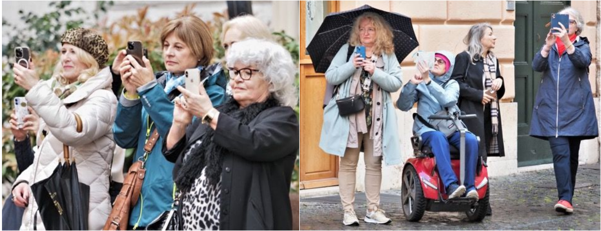
... fasziniert die angereisten Berner BPW.